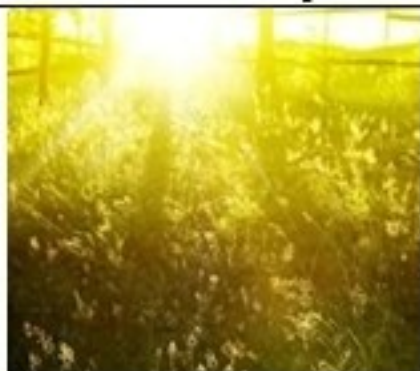
Их с утра