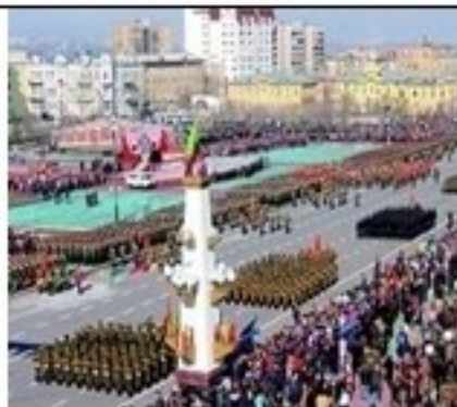
Отмечает вся страна.