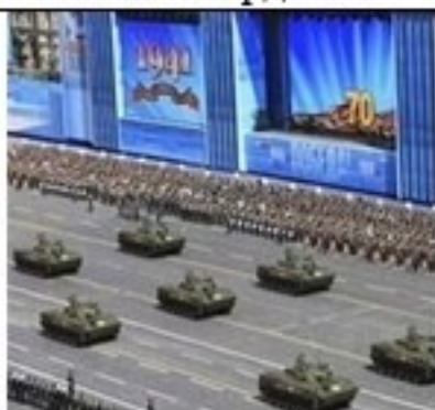
На торжественный парад,