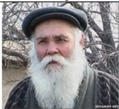
Надевают наши деды