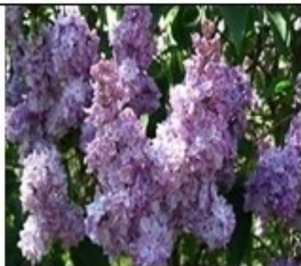
Майский праздник -